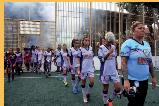
Jugadoras de la Associação Atlética Pró Esporte