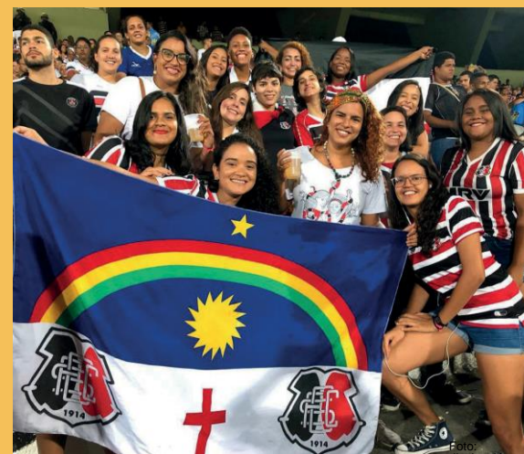
Hinchas del Movimento Coralinas

Es importante señalar que el Movimento Coralinas no se considera una hinchada oficial. Se involucra políticamente en algunos temas y demandas y, de esta forma, dialoga directamente con los directivos, pidiendo mejores condiciones en los estadios para las mujeres y más políticas dirigidas a las hinchas. Exigen para las mujeres la misma estructura que se les da a los hombres. Coralinas también realiza campañas de sensibilización sobre violencia de género, entre otras acciones.