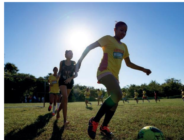
5 Niñas del Proyecto Futebol Feminino

El Proyecto Gol pela Paz , por su parte, atendió a niños, niñas y adolescentes de 13 a 17 años, en los municipios de São Luís, São José de Ribamar y Paço de Lumiar, también en Maranhão; y el Proyecto La League usó la metodología de la organización y agregó técnicas y actividades de fútbol: las niñas, niños y jóvenes se convierten en Campeonas y Campeones del Cambio en sus comunidades;