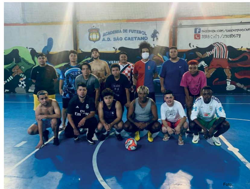
Practicantes e integrantes de Meninos Bons de Bola

El fútbol de MBB va más allá de las cuatro líneas del campo: después del entrenamiento realizan un diálogo en el que buscan fortalecerse y establecer un territorio de pertenencia y socialización entre los integrantes del equipo.