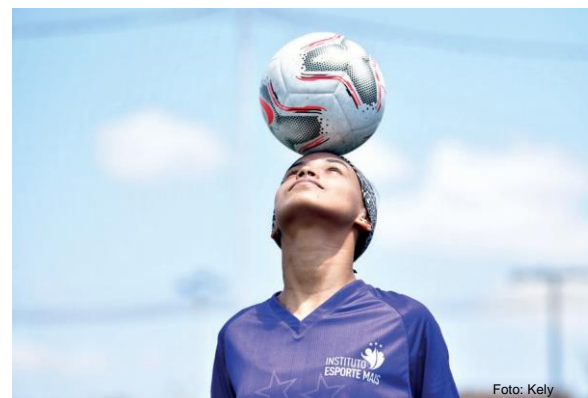
Miembro del Proyecto del Instituto Esporte Mais

Estas mujeres han dedicado su vida a la transformación social. De su motivación surgió el Instituto Esporte Mais (IEMais). IEMais es una organización de la sociedad civil fundada en 2014, en Ceará, con la misión de promover el desarrollo humano y el empoderamiento de niñas, jóvenes y mujeres a través del deporte, contribuyendo a la construcción de la ciudadanía, la inclusión y el cambio social.