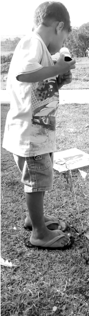
Bruna Leite / tdhA

En el inicio de la pandemia, el equipo de trabajo empezó el confinamiento y comenzó a reflexionar sobre las posibles estrategias de intervención, logrando desarrollar distintas acciones: